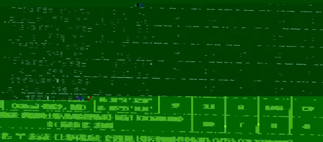
表 1. 表 2-4 点位检测结果表